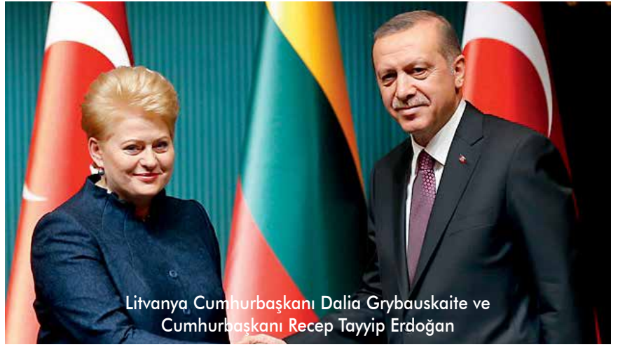
Litvanya Cumhurbaşkanı Dalia Grybauskaitė ve Cumhurbaşkanı Recep Tayyip Erdoğan