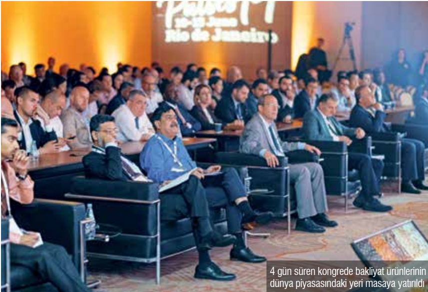
4 gün süren kongrede bakliyat ürünlerinin dünya piyasasındaki yeri masaya yatırıldı

"Trinidad ve Tobago, Guyana, Saint Lucia'da nişasta, domates, mango ve Afrika bölgesinde ağırlıklı olarak mısır, darı, börülce ve prinç israfı artan ürünler arasında yer alıyor."