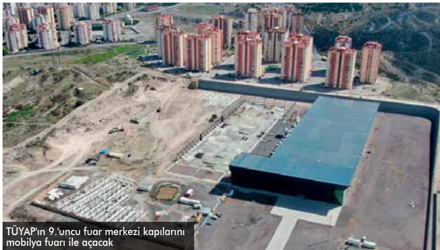
TÜYAP'ın 9.uncu fuar merkezi kapılarını mobilya fuarı ile açacak

mobilyanın Türkiye'de yatak, baza ve kanepeler üretiminin büyük çoğunluğu Kayseri'de gerçekleştiriliyor. Şehirde kayıtlı olarak büyük, orta ve küçük ölçekli yaklaşık bin 500 mobilya üreticisi faaliyet gösteriyor. Bu firmaların 600'ü seri üretim yapan firmalar. Kayseri 30 farklı ülkeye yıllık 2.2 milyar dolar ihracat gerçekleştirirken bunun önemli bölümünü Kayseri Mobilyası oluşturuyor. 2023 yılında 5 milyar dolar seviyesine çıkması hedeflenen ihracat oranının yine büyük bir kısmının mobilya sektörünün başarısı ile gerçekleştirilmesi planlanıyor. Tüm bu hedeflerin gerçekleştirilmesi adına 40 yıldır Türkiye'de ve Dünya'nın çeşitli bölgelerinde hemen her sektörde fuarlar düzenleyen TÜYAP, 9. Fuar merkezinde gerçekleştireceği Kayseri 8. Mobilya Fuarı ile kapılarını ziyaretçilerine açmaya hazırlanıyor.